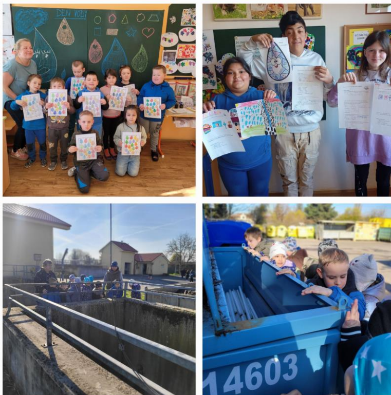
(Den VODY-exkurze na místní čističce odpadních vod)