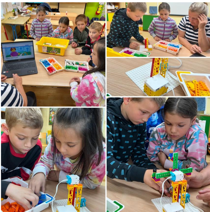
(stavebnice Lego Educational Spike: zábava + programování v PT)