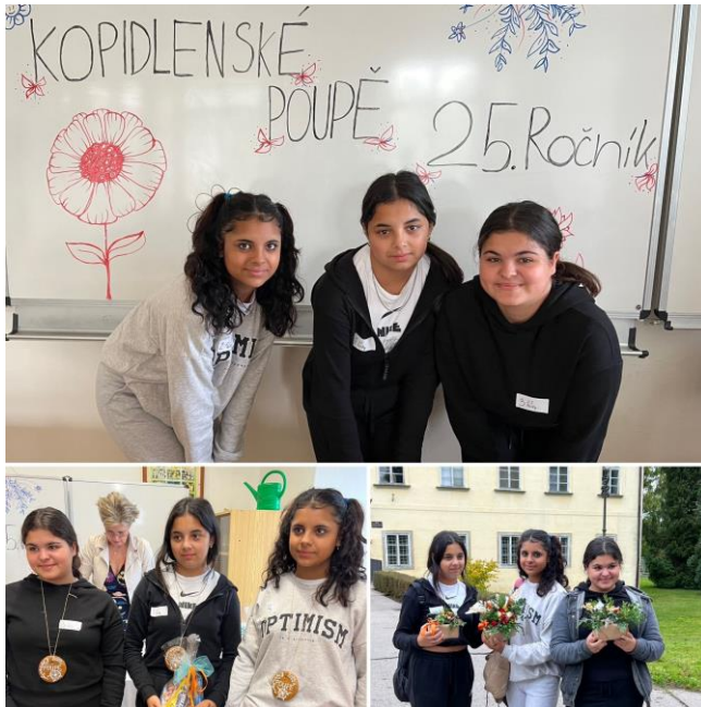
(Kopidlenská pouť 2023)