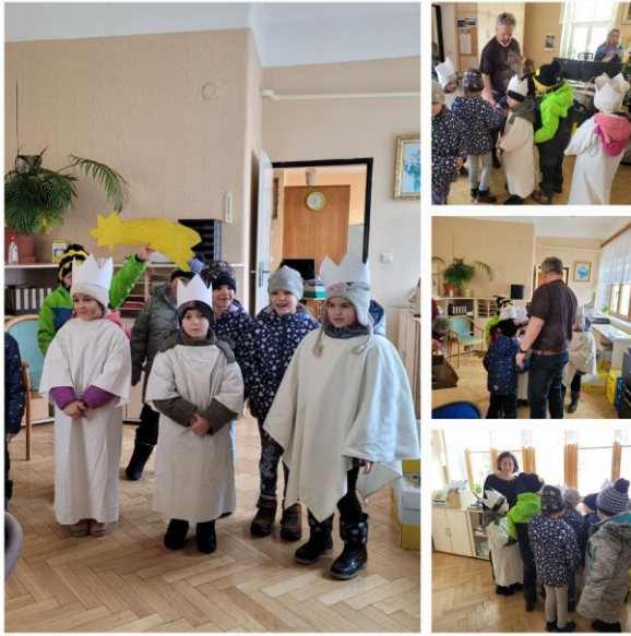
(Tříkrálová obchůzka-přejme do nového roku na radnici)