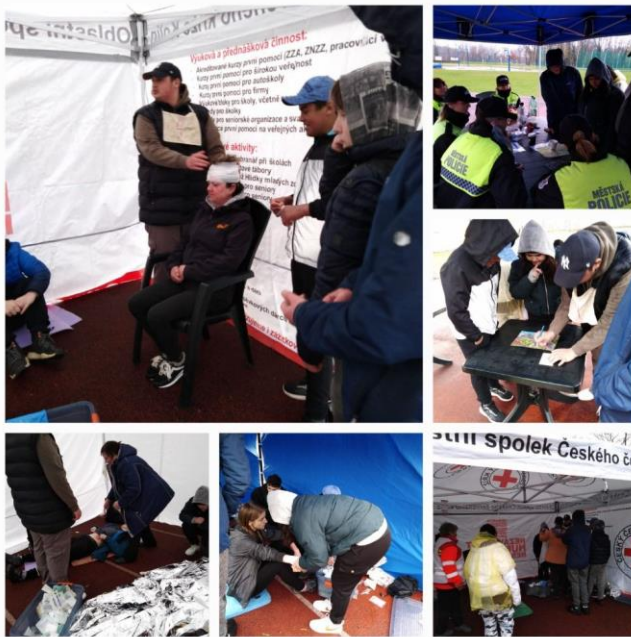
(Soutěž Mladý zdravotník – Kolín)