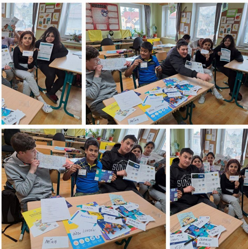
(Z hodiny anglického jazyka – tematická slovní zásoba Londýn)

Hodnocení jazykového vzdělávání: neprospěla 1 žákyně (vysoká neomluvená absence) Od 3. ročníku se žáci školy učí cizí jazyk-anglický jazyk.