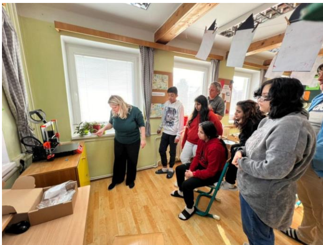
(Žáci se seznamují s 3D tiskárnou)