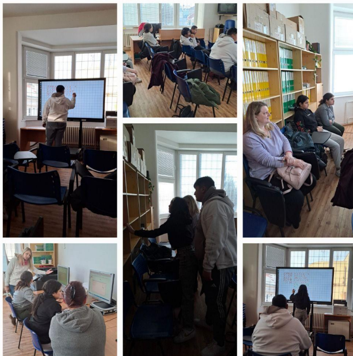
(beseda: ÚP Kolín-Volba povolání)

Péče o vycházející žáky je jednou ze stěžejních. Pomoc žákům při výběru další školy (pomoc s vyplňováním přihlášky, odesláním, lékařským vyšetřením), účast žáka na dnu otevřených dveří jednotlivých škol v regionu. Pravidelně navštěvujeme jednotlivé školy-blíže se seznamujeme s chodem školy, učivem školy, motivujeme žáky pro konkrétní obor (Katolická škola Kolín, SOU a OU Městec Králové, SOU A OU Nymburk aj.). S žáky se pravidelně účastníme burzy školy v Kolíně, kde se soustřeďuje největší přehlídka středních škol a odborných učilišť ve Středočeském kraji.