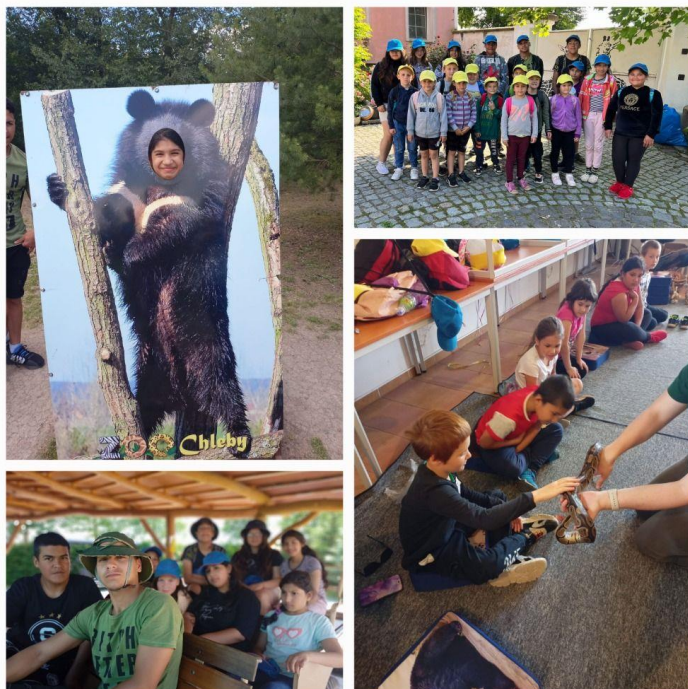
(Celoškolní závěrečný výlet: ZOO Chleby)