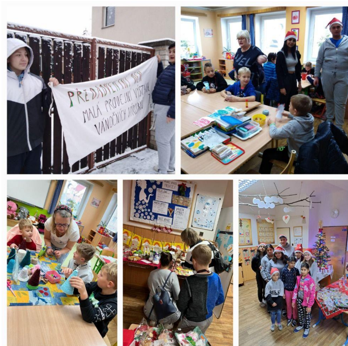
(Malý vánoční jarmark)