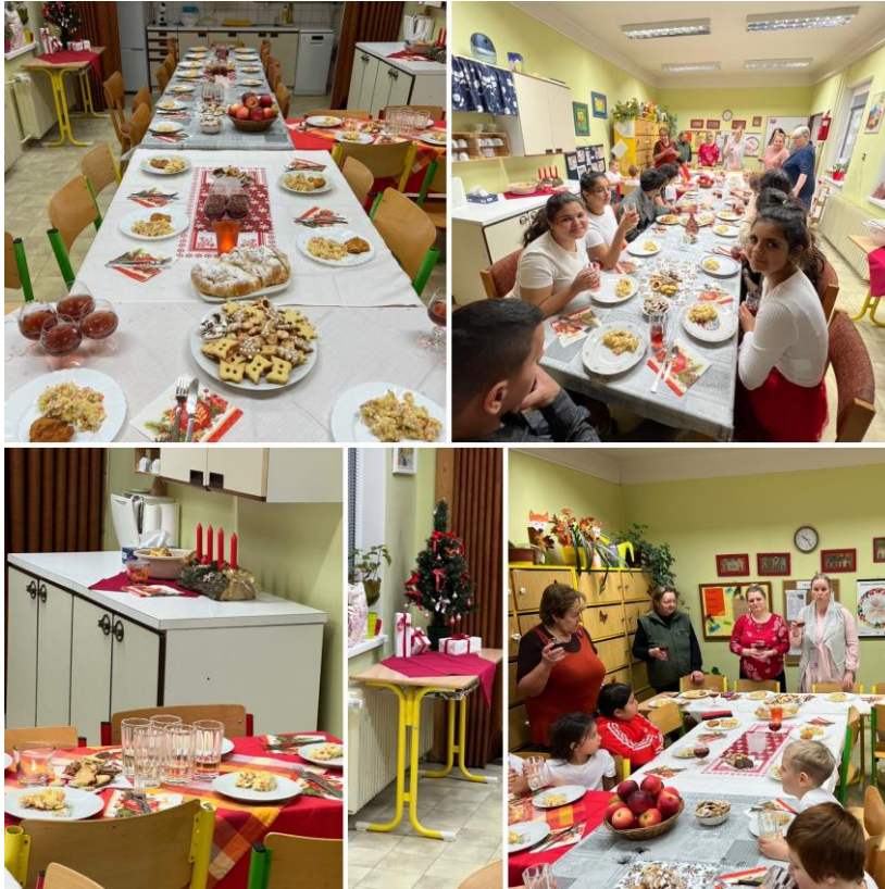
(Štědrý den ve škole)