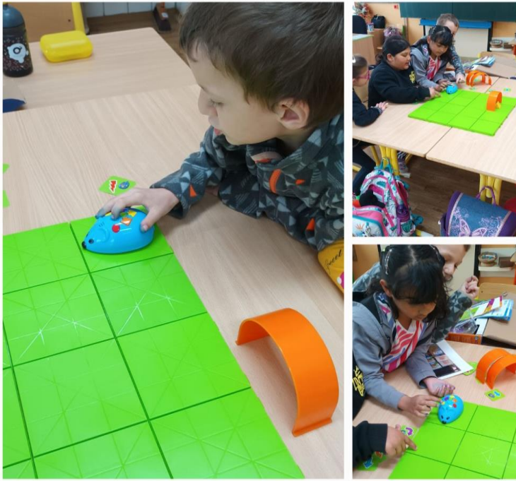
(Využití digitální pomůcky Bee-Bot žáky přípravné třídy)