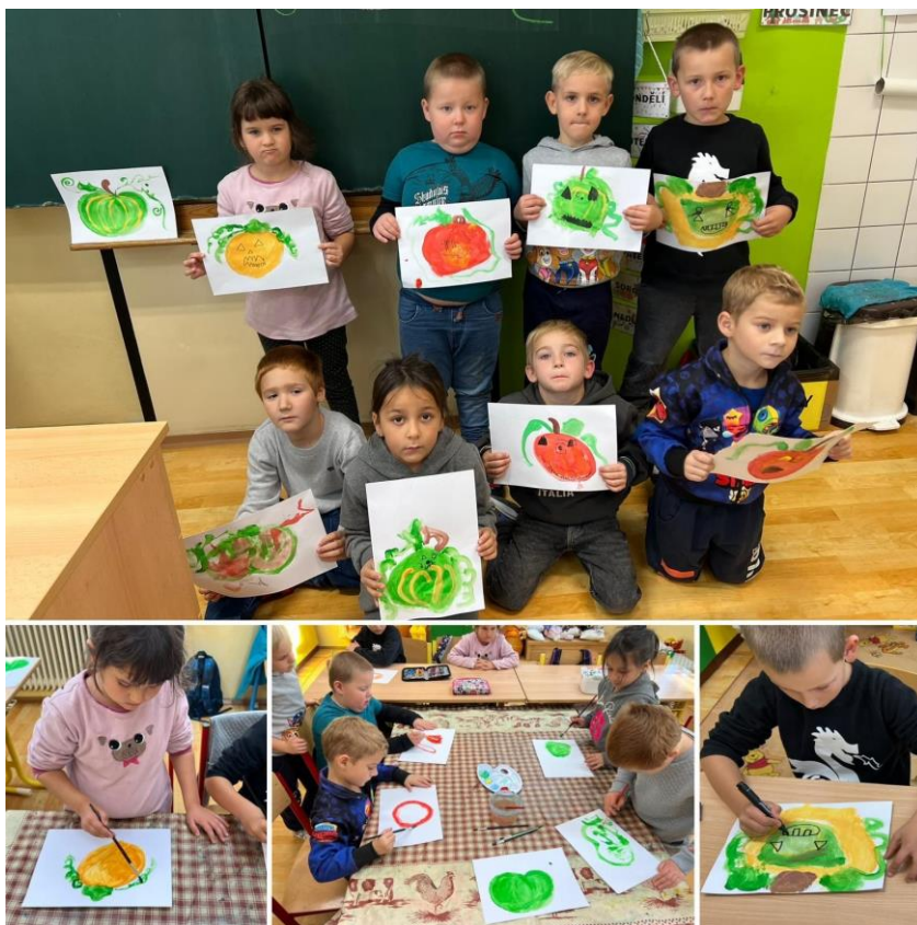
(Z hodin pracovní-výtvarných činností – přípravná třída.)