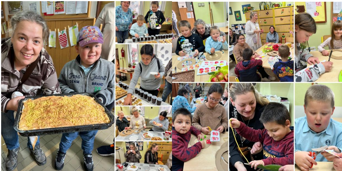
(„Jablkobraní“ - akce pro rodiče)