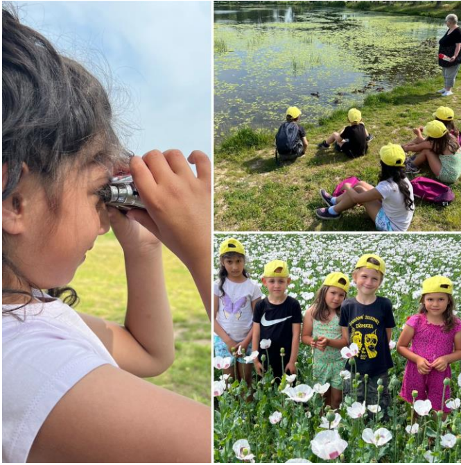
(Ekologická vycházka k místnímu rybníku – pozorování žab, změn v přírodě, využití didaktických pomůcek-přípravná třída)