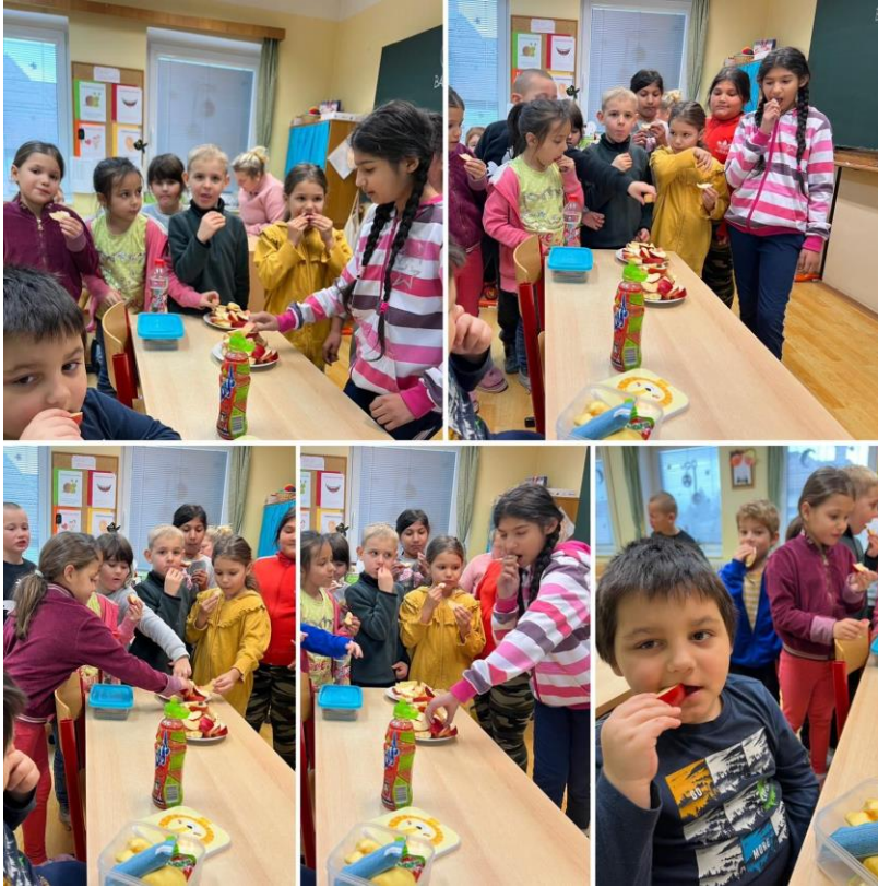
(Projekt – Ovoce do škol: ochutnávka)