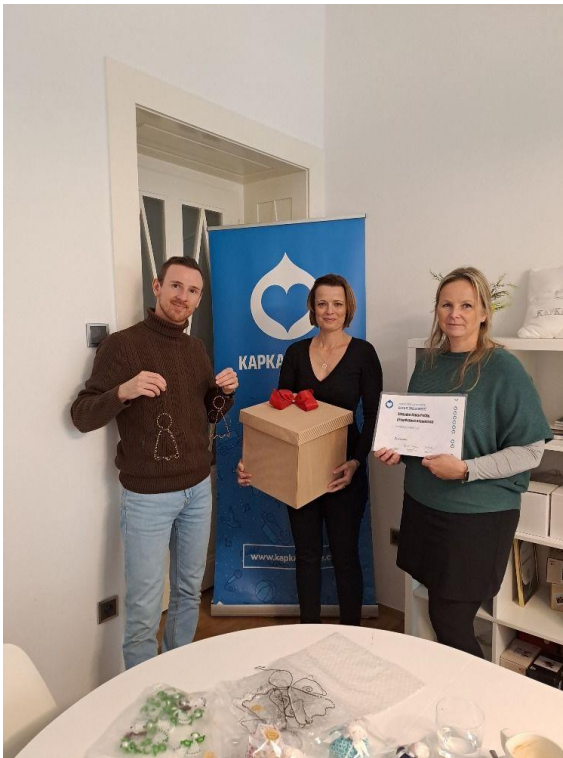
(Spolupráce s Kapkou Naděje.

Předání rukodělných výrobků od našich žáků všem těm, kdo se pomáhají starat o onkologicky nemocné pacienty)