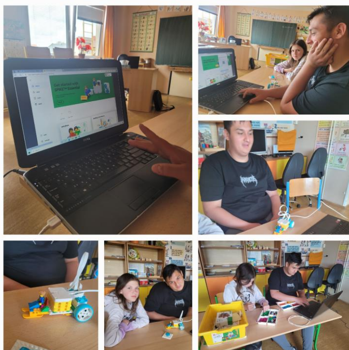
(stavebnice Lego Educational Spike: zábava + programování na 2. stupni)